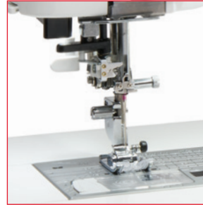
Superieure naaldinrijger & verbeterde naaiveldweergave